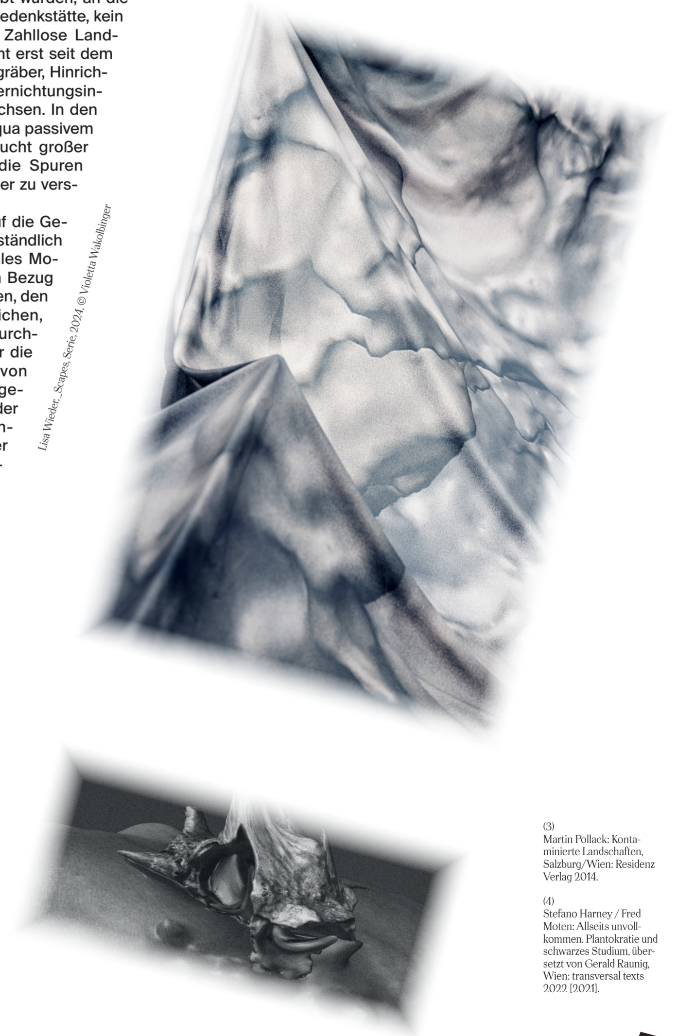
Lisa Wieder, _Scapes, Serie, 2024, © Violetta Wakolbinger

sein, unsere vermeintliche körperliche wie soziale Abgeschlossenheit als Einzelne zu negieren – und somit auch die Abgeschlossenheit von all dem, was uns umgibt.