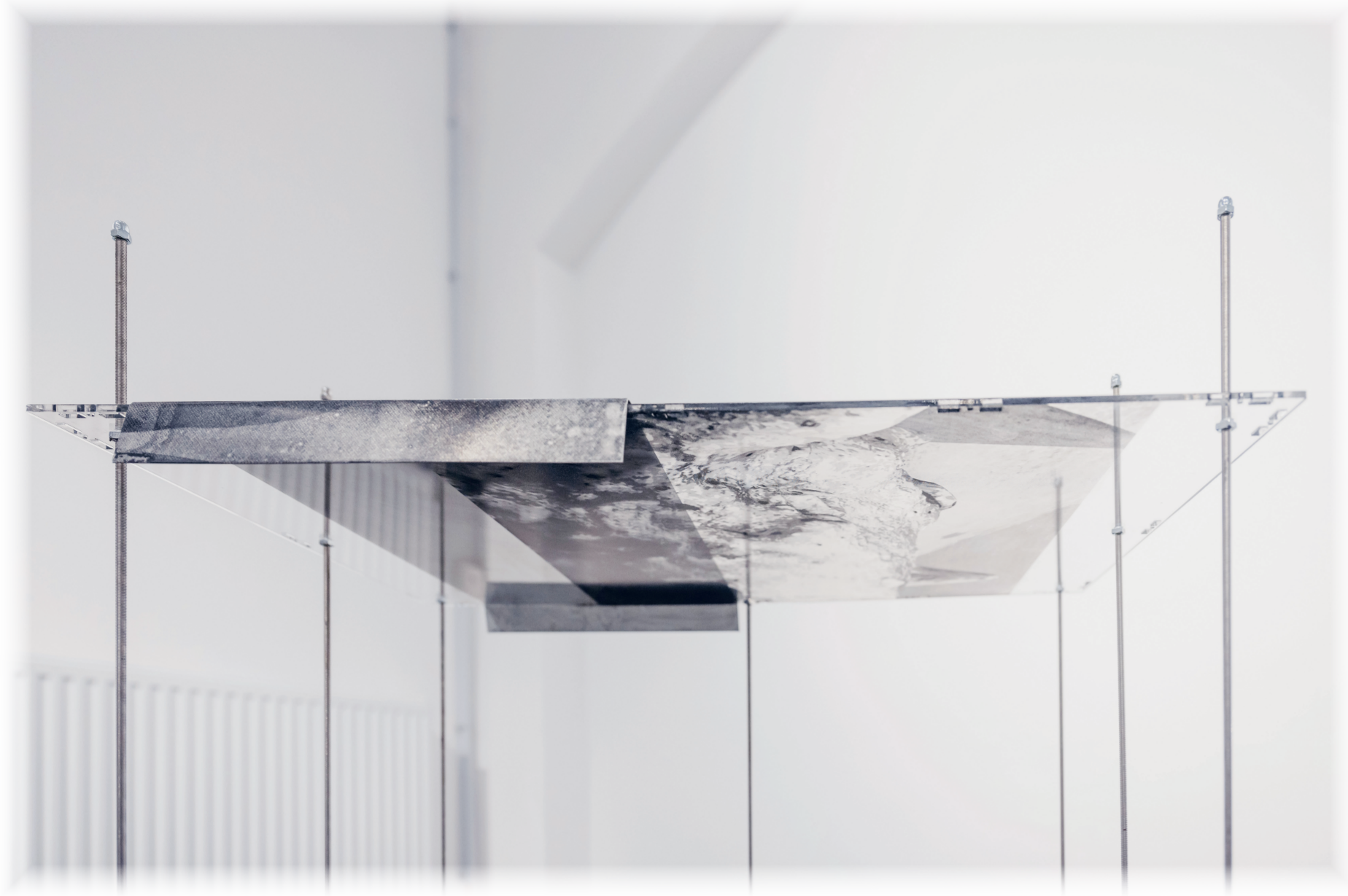
Lisa Wieder, _Scapes, Serie, 2024